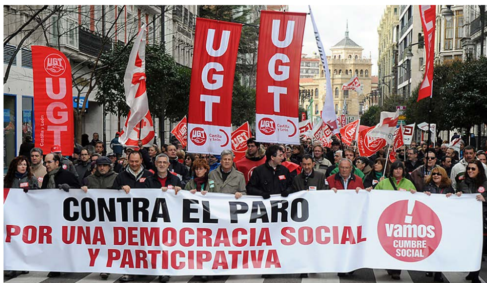
Miles de vallisoletanos convocados para protestar "contra el paro y por una democracia social y participativa".