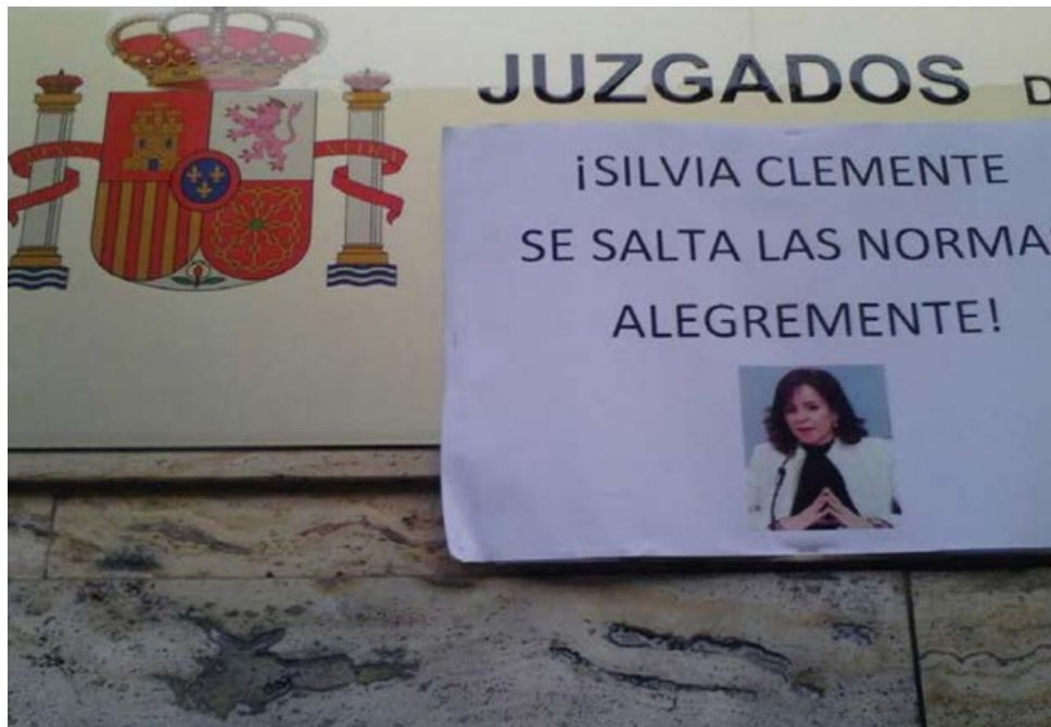
Cartel reivindicativo de Sitacyl pegado a la entrada del juzgado.